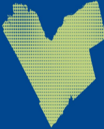
Table de direction sur le logement et l'itinérance